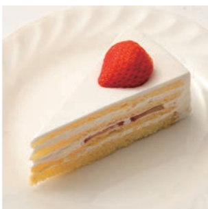
苺のショートケーキ

昔の名前はレモンケーキ。実は子供の頃、レモンパイよりもシャンティーシトロンの方が好きだった。やさしい甘さと、ほんのりとする酸っぱさ、そしてその柔らかさにもうトリコだった。