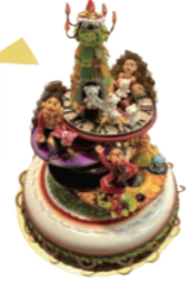
Aクラス 準優勝 👑 山下真由