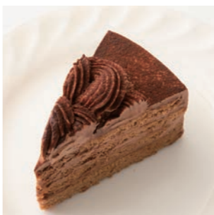
ショコラヴァローナ

実は、ケーキ屋さんが自分のところでプリンのカラメルを炊いているのは当たり前ではない。むしろ意外と炊いていない方が多い。だから食べ比べれば分かる自家製カラメルのプリンの美味しさ。