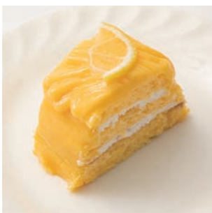
シャンティーシトロン

これを食べて美味しさが伝わらなかったらもうゴメンナサイするしかないというエルベランの一番人気ケーキ。日本人が日本人のために作ったケーキ、それがエルベランのレモンパイです。