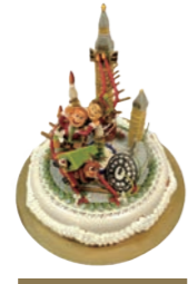
Bクラス 第3位 👑 引野麻以