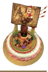
Bクラスワンポイントビューティフル賞 👑 競友音